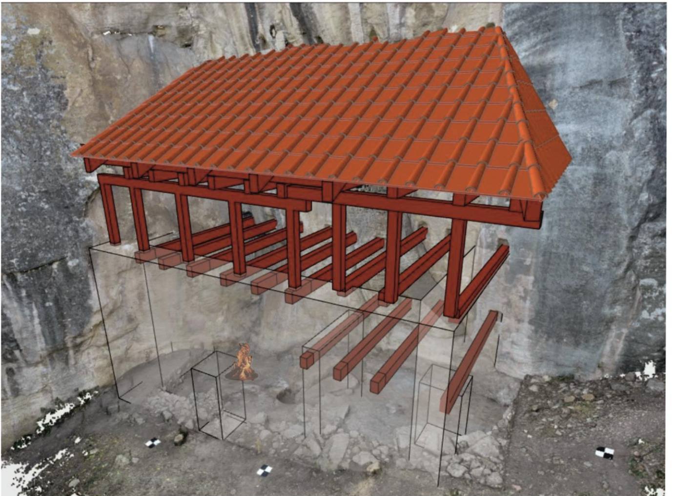
Идейна възстановка на храмовата сграда