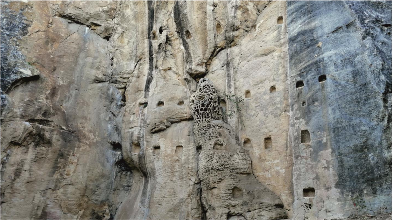
Изсечени в скалния масив ниши за греди от етажната и покривна конструкция